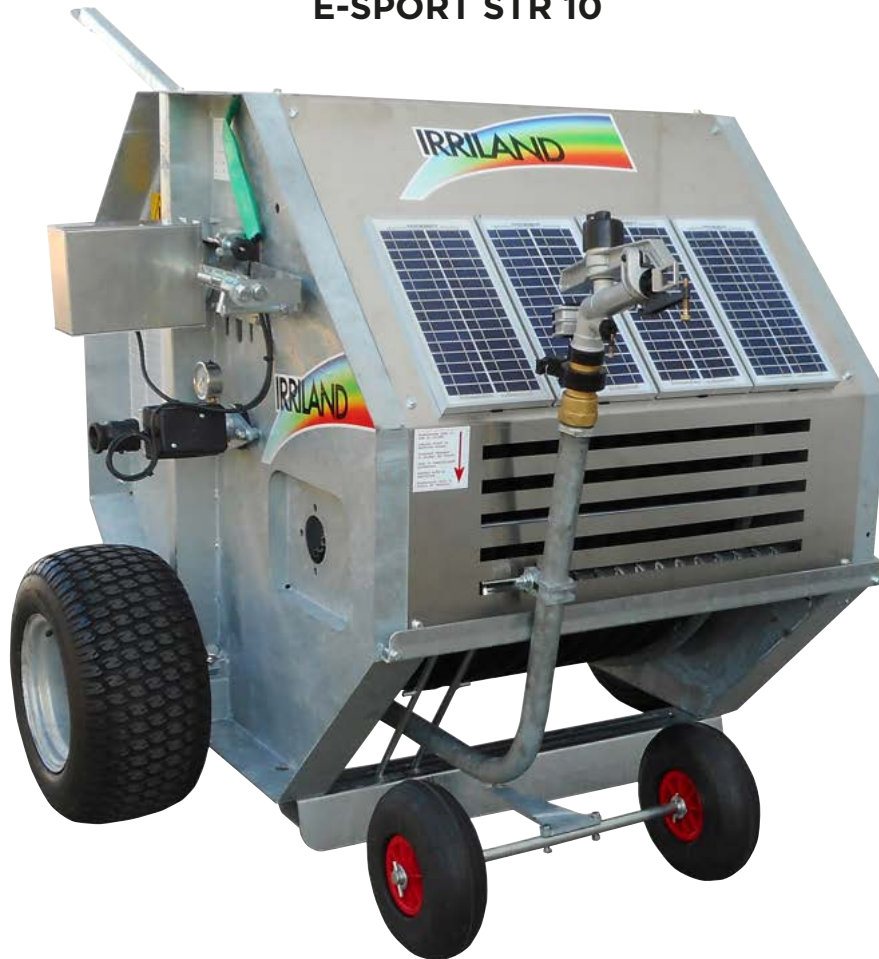
E-SPORT STR 10